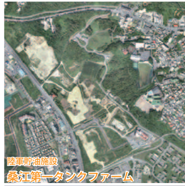
陸軍野油施設 第一桑江タンクファーム