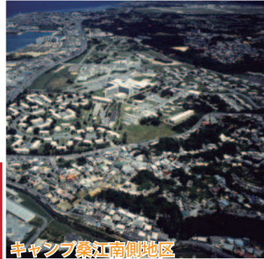
キャンプ桑江南側地区